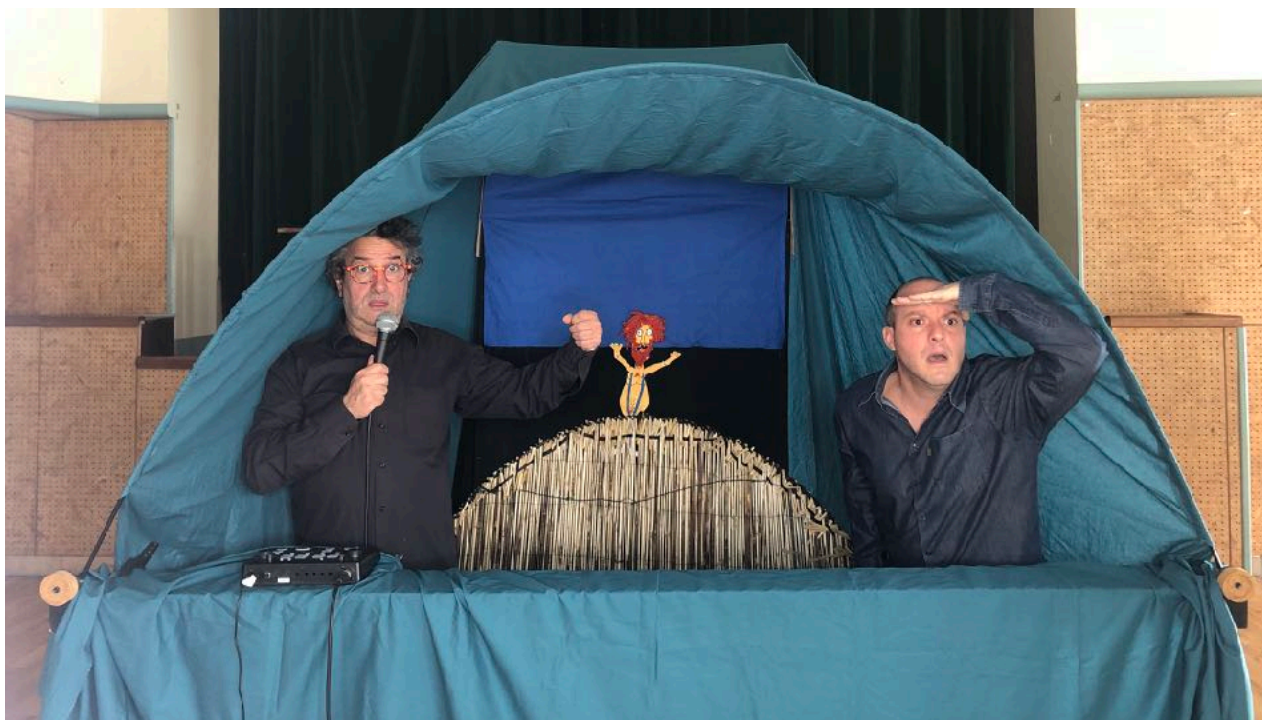
Voyage à bord de baleine. Ecole du Séquoia Jarcieu 12/2023