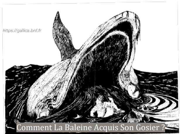
Comment La Baleine Acquis Son Gosier ?